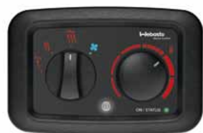
Air Top Evo Multifunktions-Bedienelement

Für einen vollständigen Überblick über Webasto Zubehörteile, beachten Sie bitte den Marine Katalog.