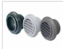
Webasto Luftauslässe (HADS)